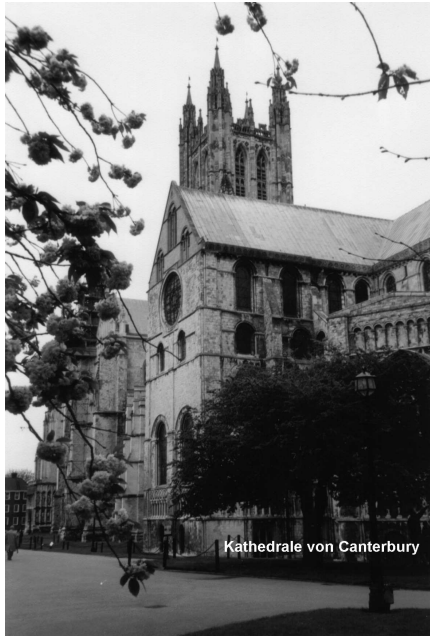
Kathedrale von Canterbury

Canterbury, bald vor uns. Der heutige Bau der Kathedrale entstand im 12.-14. Jahrhundert im Stil der englischen Spätgotik und beeindruckt durch ihre Größe und 800